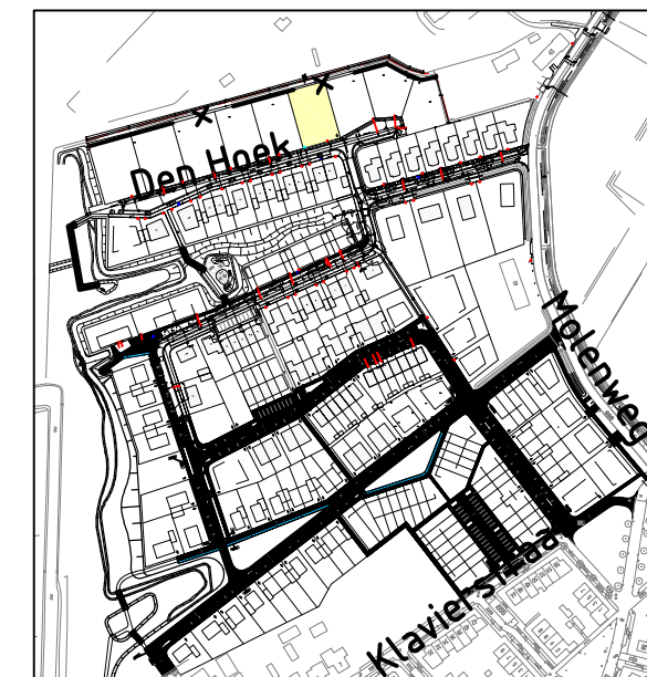
Overzicht plangebied Schaal 1:5.000